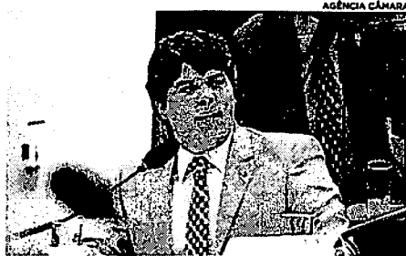
Projeto que permite aos laboratórios inserirem QR Code nas embalagens de medicamentos para acesso a uma bula digital é de autoria do deputado maranhense André Fufuca

laboratório poderá inserir outras informações, além do conteúdo completo e atualizado, idêntico ao da bula impressa. ORIGEM DA LEI A lei sancionada pelo governo federal (Lei 14.338/22) tem origem no Projeto de Lei (PL) 3846/2021, de autoria do deputado maranhense André Fufuca – líder da bancada do PP na Câmara dos Deputados. A proposta foi aprovada pelos deputados no dia 16 de dezembro do ano passado – tendo como relator o deputado Ionaldo Bulhões Jr. (MDB-AL) – e no Senado, no dia 12 de abril deste ano. O texto revoga regras sobre controle de medicamentos constantes na Lei 11.903/2009,